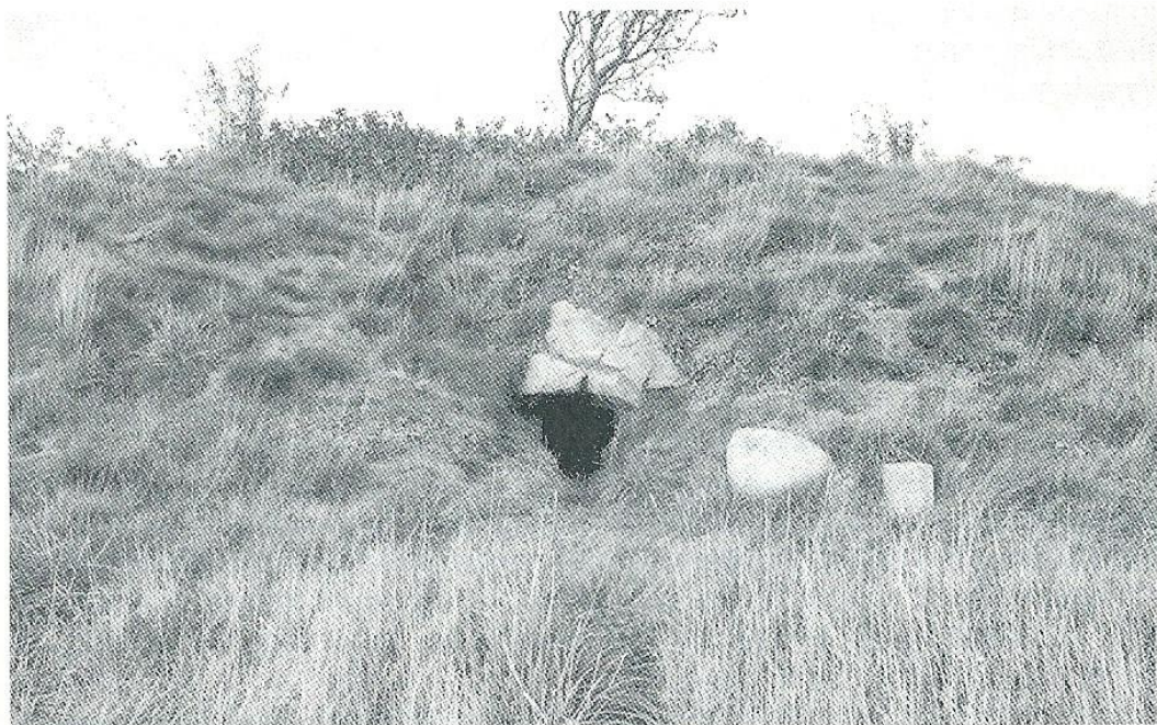
Jættestuen i Bøel.

Den historie, som de arkæologiske bopladsfund og gravfundene tegner, er anonyme, forstået på den måde, at vi ikke kender menneskene bag historien, men kun et ganske lille udvalg af deres efterladenskaber. Historien om det